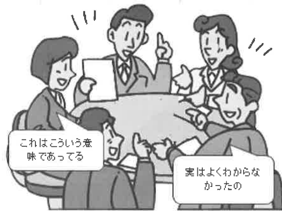
図 1：曖昧な情報を「理解する」ために質問しやすい環境の場をあたえる