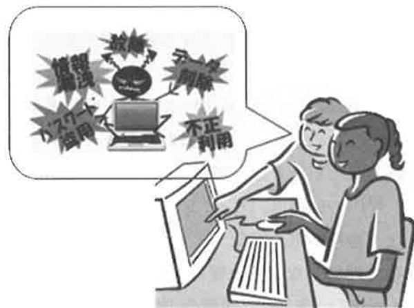
図3：無意識のセキュリティ意識向上

すれば、受講者はPCを使うに当たって自分を守るための当たり前の知識として頭の中に残るようになる(図3)(図4)。