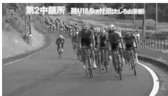
図7 第2中継所からの映像

第2中継所はコースのほぼ中間地点に設置した。比較的平坦で緩やかなカーブのため、選手は高速で駆け抜ける。この地点でも電源が確保できなかつたため、電源にはカセットガス発電機を使用した。第2中継所からの配信映像を図7に示す。