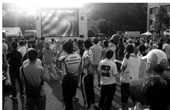
図 12 パブリックビューイングディスプレイ

ロード競技時には、スタートゴール地点そばの、メイン会場となる錦江町役場田代支所前にこの大型モニタが設置された(図12)。モニタには、AVスイッチのビデオ出力(コンポジット)が直接表示された。さらにAVスイッチ出力映像はメイン会場の解説者にも提供され、レースの解説にも利用されることになった。