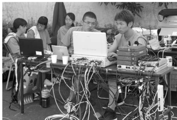
図 11 ロード競技の中継ブース

カメラと AV スイッチの接続は、移動中継所を除き、映像転送装置を介しての接続とした。AV スイッチは錦江町役場田代支所前駐車場のテント内に設けた中継ブース (図 11) に設置した。