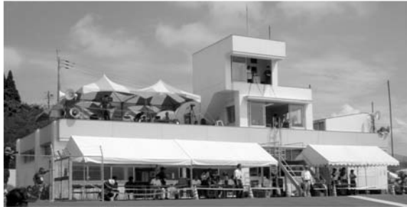
図3 根占自転車競技場管理棟