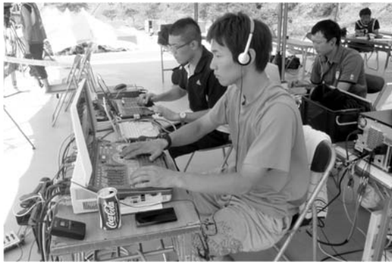
図4 トラック競技中継ブース

技場で、南大隅町根占地区の山間部に位置している。管理棟の3階は審判用のカメラ撮影用スペースとなっており、トラック全体を見渡すことができる。今大会ではこのスペースが審判用途に使用されず、また電源の利用も可能であったため、ここにカメラを2台設置した。ただし、最上階にはそれ以上の機材を設置するスペースがなかったため、AVスイッチやUstream送信用PCなどの中継ブースは2階屋上部分に設置された報道関係者テント内(図3左上)に設置した。トラック競技の中継ブースを図4に示す。スペースの都合で管理棟3階に設置できなかった3台目のカメラもこの中継ブース付近に設置した。さらにこれらに加えて、トラック内から競技の様子や選手へのインタビューを撮影する