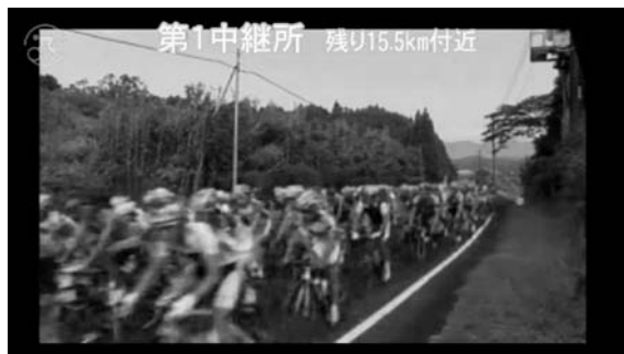
図6 第1中継所からの映像

第1中継所はロードコース中で最も長い直線区間を望む地点に設置した。コースはここから本格的な上り坂になる。長い直線区間を選んだのは、選手の様子を比較的長時間撮影できると考えたためであった。この地点には周囲に民家もなく電源を確保できなかつたため、電源にはカセットガス発電機を使用した。第1中継所からの配信映像を図6に示す。