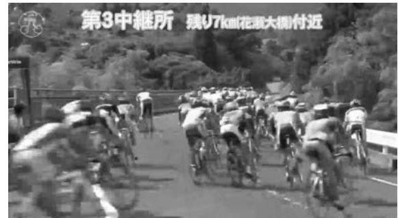
図8 第3中継所からの映像

メラからは、カーブ後の接触で落車する選手の様子も確認することができた。ここでは、カメラを設置した歩道のすぐ後ろに隣接する民家に役場職員を通じて依頼し、電源を借用することができた。第3中継所からの配信映像を図8に示す。