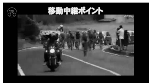
図9 移動中継所からの映像

移動中継所は小型のカメラ (SONY社製 HDR-HC3)、USBビデオキャプチャ (BUFFALO社製 PC-SDVD/U2G)、ノートPC (Core 2 Duo U9400・4GBメモリ)、そしてモバイルルータ (BUFFALO社製 DWR-PG) により Ustream に直接送信する中継地点である。任意の場所に設置が可能であったが、カメラを設置できるスペースがあり 3G データ通信が可能であった、ゴール前 800m の最後の上り坂に設置した。電源はインバータを用いて自動車から供給した。移動中継所からの配信映像を図9に示す。