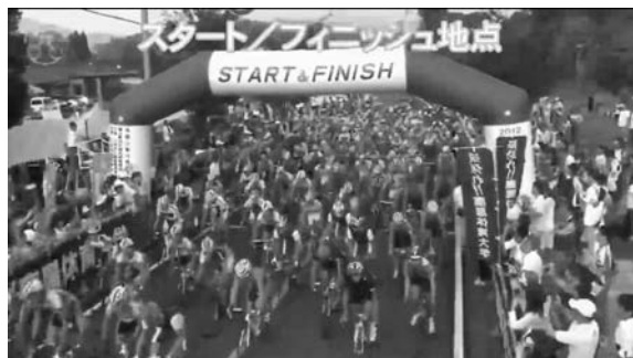
図 10 スタート・ゴール中継所からの映像

との接続は道路を挟み 20m 程度離れていたため、映像転送装置と Wi-Fi により接続した。電源は隣接する公共施設から得た。スタート・ゴール中継所からの配信映像を図 10 に示す。